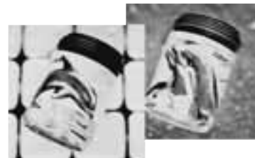
2er-Set Tanzender Delfin und Jumping Delfin