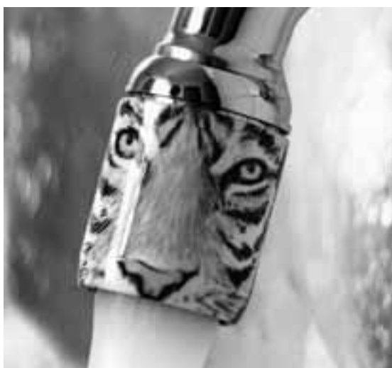
Der AquaClic hilft sparen, ohne dass Sie es bemerken.

Mit den AquaClics sparen Sie mit einem Dreh rund die Hälfte des Wassers und ebenso viel Energie, die für die Erwärmung des Warmwassers benötigt wird. Denn zwei Drittel unseres Wasserkonsums – in der Schweiz verbraucht jede Person täglich 165 bis 180