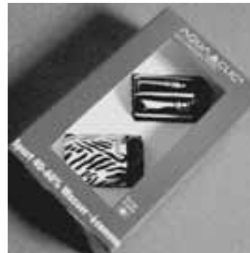
Contraste und People alle 2er-Sets für Fr. 40.– statt Fr. 56.–

Profitieren Sie daher von unserem Angebot – es lohnt sich für unser Trinkwasser. Die Aqua-Clic-Aktion in den WWF-Läden dauert vom 1. Februar bis zum 22. März 2003: Ein 2er-Set in der Box kostet dann nur Fr. 40.– statt Fr. 56.–. Wasser sparen zahlt sich aus!