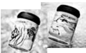
2er-Set Wale und Wasserwelt

WWF-Laden Zürich Dufourstrasse 31 8008 Zürich Tel. 01 252 93 80 E-Mail: wwfladen@wwfz.ch Internet: www.wwfladenzuerich.ch Öffnungszeiten: Mo.-Fr. 10:00 – 18:30, Sa. 10:00 – 16:00 Uhr