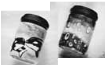
2er-Set Orca mit Baby und Raindrops