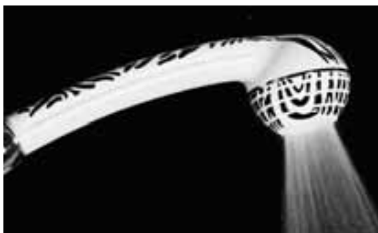
Mit dem ClicDouche duschen Sie nur noch mit etwa der Hälfte Wasser.

Noch Unentschlossene können unter www.aquaclic.ch/analyse.html herausfinden, wie viel Wasser, Energie und Kosten sie sparen können. Denn jeder Tropfen, der ungenutzt in den Ablauf rinnt, ob vom Wasserhahn, der Dusche oder der Toilette, muss aufwändig gereinigt und wieder aufbereitet werden.