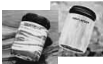
2er-Set Welle und Mystery